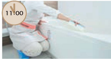
お風呂掃除 腰を曲げての作業がつかいので依頼。