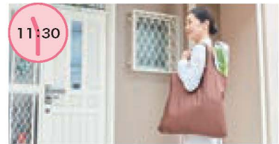
買い物 日中の買い物も気軽に依頼。