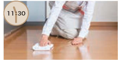
拭き掃除 床や棚の拭き掃除も足が痛いとできないので依頼。