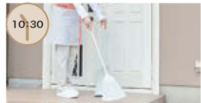
外まわりの掃除 玄関まわりはいつもキレイにしておきたいもの。