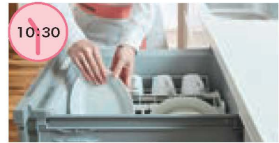
キッチンの片づけ 朝食の後片付けから食器洗い・キッチンのお掃除を依頼。