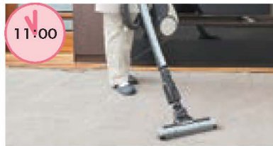
掃除機かけ 普段できないところもすみずみまで。