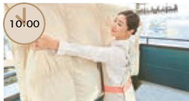
布団干し 重たい布団の上げ下ろしは、定期的に布団干しを依頼。