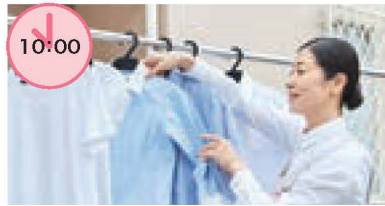
洗濯物干し 洗濯物の取り込みや、たたむ作業も頼めます。