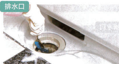
排水口の中までしっかりキレイに。