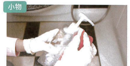
細かな部分の汚れまでていねいに。