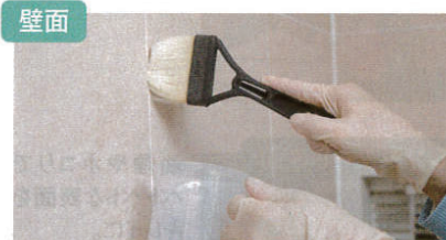
しつこいカビもすみずみまで除去。