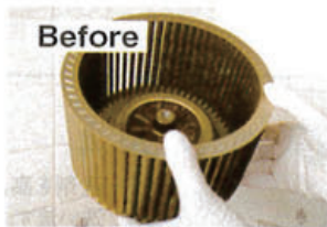
油汚れがすみずみまでこびりついています。