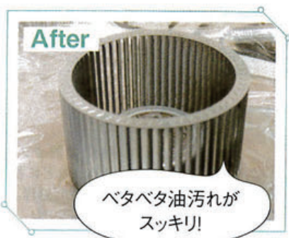
ベタベタ油汚れが スッキリ!