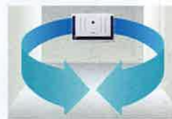
※気流による循環イメージ

2方向への空気の吹き出しで室内に気流をつくり、スピーディーかつ効率的な集塵を実現。ルーバーの向きを調整することで、細かなチリやホコリ、ニオイを確実に捕らえ、室内の隅々までキレイな空気を届けます。